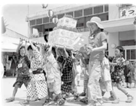
手作りおみこしで夏祭り(松井ヶ丘幼稚園)