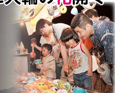
①夜店で目を輝かせる子どもたち ②夜空を彩る1,500発の花火は圧巻

8月15・16日、田辺公園多目的運動広場などで市民グループによる京田辺夕涼みの集いが開かれ、市内外から多くの人を訪れました。来場者は夏の夕暮れのひとときを、夜店や花火で楽しみました。