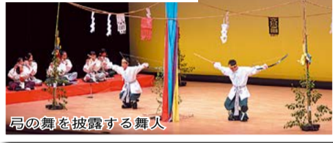
舞の舞を披露する舞人

昨年、この準人舞が縁で霧島市と大規模災害時における相互応援協定を締結しました。遠方の自治体との連携は、大規模災害時に非常に心強く、交流が密なほど大きなものとなります。