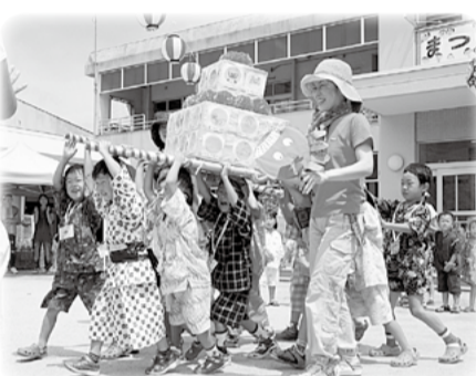
手作りおみこしで夏祭り(松井ヶ丘幼稚園)