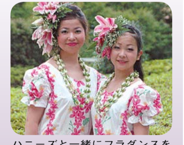
ハニーズと一緒にフラダンスを楽しみましょう

同志社大学は、見る! 聴く! 踊れる! アロハフェスティバルを開きます。アロハシャツで来場した人には、すてきなプレゼントがあります。 日時=9月27日(金) 時間=午後5時15分から 場所=同志社大学京田辺校地多目的ホール 出演=▼ハワイアン姉妹バンドのハニーズ▼学内フラダンスサークルのメアフラノヘアラニ 内容=▼第1部・一緒に踊ろうフラダンス...ハニーズとメアフラノヘアラニにフラダンスを教わります▼第2部・ハニーズコンサート...ハワイアンスタイルギターの音色を楽しめます 参加費=無料 問合せ先=同志社大学京田辺校地学生支援課(☎65-7021) 同志社大学京田辺校地には駐車場はありませんので、公共交通機関をご利用ください。