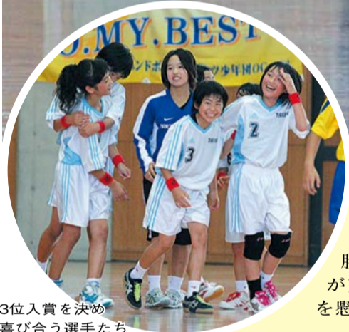
3位入賞を決め喜び合う選手たち

8月1～4日、第26回全国小学生ハンドボール大会が田辺中央体育館などで開かれ、各地の予選を勝ち抜いた70チームの強豪が京田辺市に集結。全国制覇を懸け熱戦を繰り広げました。