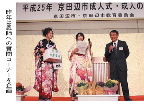
平成25年 京田辺市成人式・成人のつどい 京田辺市・京田辺市教育委員会

【成人式・成人のつどい】 日にち=平成26年1月12日(日) 時間=午後1時から 場所=田辺中央体育館 対象=平成5年4月2日~同6年4月1日生まれの成人 会議の回数=5回程度 申込方法=FAXか電子メール、はがきに住所・氏名・生年月日・電話番号・メールアドレスを書いて申し込みください