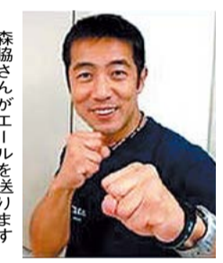
森脇さんがエールを送ります

大学生と作る光のおもちゃ 同志社ローム記念館は、ものづくり教室を開きます。 学生や卒業生が、縦一列に並んだLED電球を振って文字などを浮かび上がらせるおもちゃ「パーサライタ」の作り方を教えます。 日時=10月14日(祝)午後3時~5時30分 場所=同志社大学京田辺校地ローム記念館 対象=小学校3年生~中学生 小学生は保護者の同伴が必要です。 定員=15人 多数の場合は抽選します。 参加費=500円 申込方法=はがきか電子メールに、「ものづくり教室参加希望」・氏名・学年・郵便番号・住所・電話番号を書いて申し込みください しめきり=10月4日(金)(必着) 申込・問合せ先=同志社ローム記念館プロジェクトROBOX(〒610-0394 京田辺市多々羅都谷1-3、☎65-7800、メールアドレス:kirarin@robo-doshisha.org)