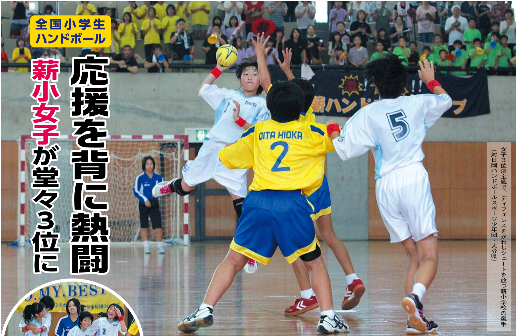
女子3位決定戦で、ディフェンスをかわしシュートを放つ薪小学校の選手 (対日岡ハンドボールスポーツ少年団・大分県)