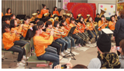
バンド演奏で華やかに開幕(昨年の様子)