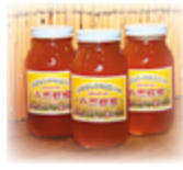
京田辺産 天然はちみつ 3名様

はがきに次の質問の回答と郵便番号・住所・氏名・年齢・日中連絡がつく電話番号を書いて郵送してください。応募は広報紙のほか、京田辺市eモニター(たなモニ)でも受け付けています。