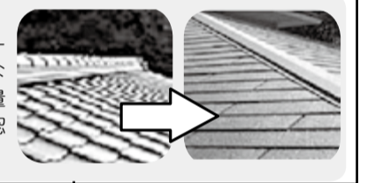
【工事例】瓦屋根からスレート屋根に変えるなど※部分的な軽量化は建築士の確認が必要ですよ