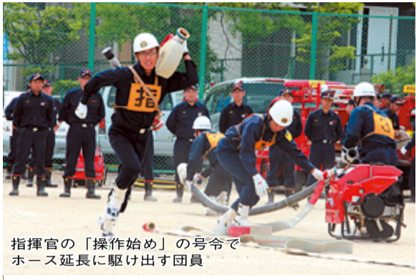
指揮官の「操作始め」の号令でホース延長に駆け出す団員