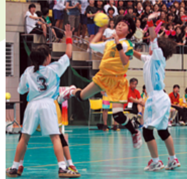
ムは、8月1日(木)から開かれる第26回全国小学生ハンドボール大会に、全国一を懸け出場します。

6月8・9日、田辺中央体育館などで第28回京田辺市小学生ハンドボール大会兼第29回京都府小学生ハンドボール大会が開かれました。大会では、市内小学校のハンドボールクラブに所属する4~6年生420人が熱戦を展開。力を込めて放ったシュートが決まり喜び合う選手たちの姿に、観客席からは惜しめない拍手が送られました(=写真)。 優勝した桃園小男子・薪小女子チームと、準優勝の松井ヶ丘小男子・桃園小女子チームは、8月1日(木)から開かれる第26回全国小学生ハンドボール大会に、全国一を懸け出場します。