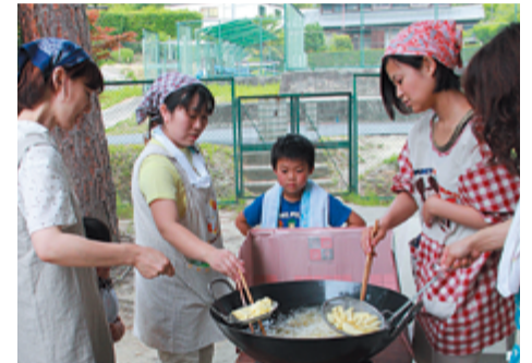
おいしいポテトフライに調理