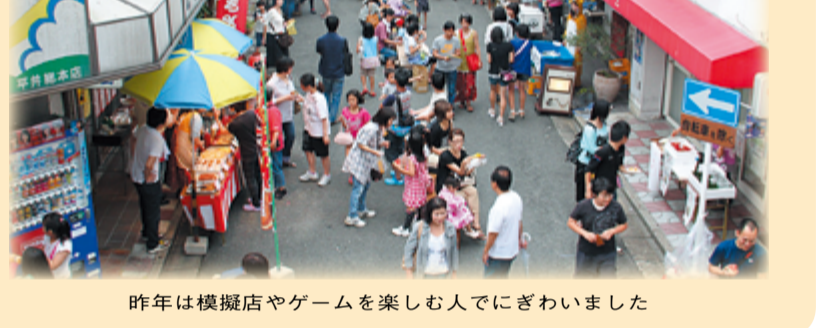
昨年は模擬店やゲームを楽しむ人でにぎわいました

【内容】 ▼模擬店・オープニング・セレモニー(午後4時～4時45分)▼ビンゴカード配布(午後4時45分、対象は中学生以下)▼ビンゴゲーム(午後6時～7時)