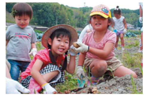
収穫を喜ぶ子どもたち