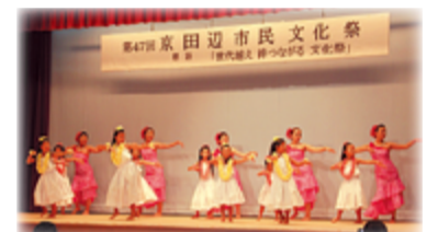
フラダンス・日本舞踊など、多彩な発表で盛り上がる会場(昨年の様子)

【標語】 市民文化祭に関する標語。句読点は不要です。最優秀賞作品は、チラシなどに掲載します。入選者は、市民文化祭の式典(11月2日)で表彰します。なお、昨年最優秀賞を受賞した人は、入選対象になりません。 応募方法 ＝はがきか応募用紙