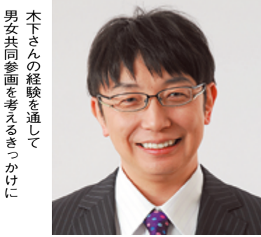
木下さんの経験を通して男女共同参画を考えるきっかけに