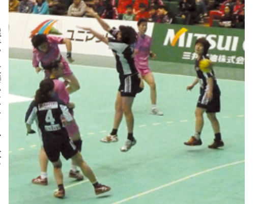
選手から直接ハンドボールを教わろう