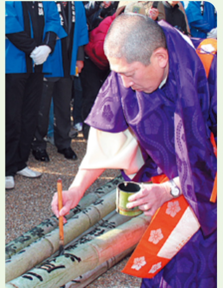
①観音寺で安全祈願の後、竹に願いをしたためる住職 ②参加者の手で無事に奈良・東大寺へ到着