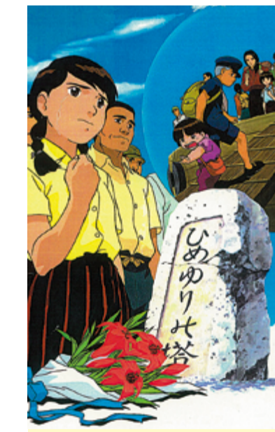
戦争の悲惨さを分かりやすくアニメで紹介

市平和都市推進協議会は、戦争の悲惨さと平和や生命の尊さを子どもたちに伝えるため、子ども平和映画会を開きます。【日にち】3月20日(祝)【時間】午前10時～11時40分(開場は午前9時30分)【場所】中央公民館【上映内容】「ひめゆりの塔(命宝物語)」(80分)1945年の沖縄戦で、従軍看護要員として戦場に送られた「ひめゆり学徒隊」。15～19歳の少女たち221人が体験した悲劇の記録。【参加費】無料【申し込み】不要【問合せ先】京田辺市平和都市推進協議会(総務室内、☎64-1337)