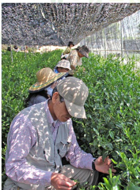
あなたも日本一に役立ってみませんか

京田辺のお茶を考える会は、出品茶支援隊募集中ボランティアを募集します。玉露の産地として知られる京田辺。全国茶品評会では、日本一の産地に贈られる産地賞を何度も受賞していますが、最近九州などの産地に日本一の座を譲っていました。今年、同品評会が地元・京都で開かれます。「日本一の玉露の産地」のタイトル奪還に向け、家族や友人と一緒に、品評会に出品するお茶の手摘みを手伝っていただきます。参加者には後日、玉露の新茶をプレゼントします。期間 4月中旬～5月上旬のうち数日間 時間 午前8時集合 摘み終わりに解散します。集合・解散場所 田辺中央体育館前 茶園までバスで迎えます。対象 18歳以上の人 作業内容 ①お茶の新芽の手摘み