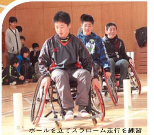
ボールを立てスラローム走行を練習

1月23日、草内小学校で車いすハンドボール教室が開かれました。同教室は、障がい者スポーツを通じて、子どもたちに思いやりの心を育んで欲しいと、京都障害者スポーツ振興会の協力で3年前から行われています。