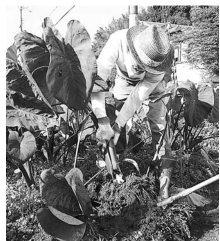
本市の振興作物えびイモの収穫