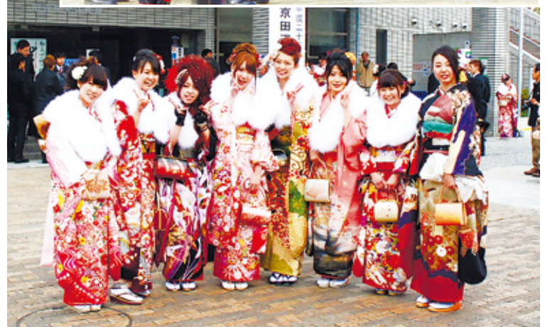
上手にコマまわし...田辺幼稚園(上) きりつと整列...出初式から(中) 新たな門出...成人式にて(下)