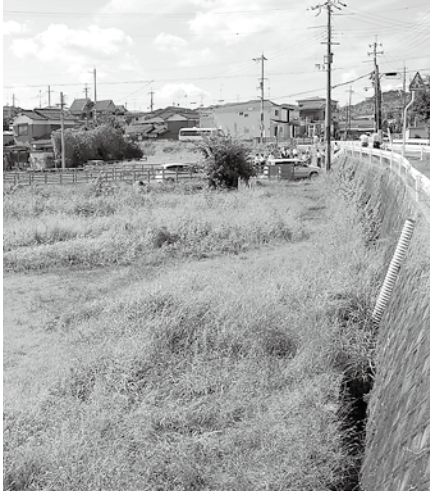
民間保育園の移転建設予定地