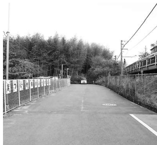
遊歩道の整備が要望されている松井ヶ丘幼稚園前道路

①若狭湾周辺原発群の事故に備え全市避難を想定した計画の具体化など市民参加も取り入れて見直しを。 危機管理監 防災計画は不断の見直しをしていく。国の見直しを注視し、市民の安全確保のための対応を国・府へ要望する。市民の声が反映できるように取り組む。 ②東日本大震災の教訓を踏まえ、マスタープランの見直しが必要。また災害被害を受けやすい地理的条件の土地の都市開発は可能な限り避けるべきということも提起されているが、市の見解は。教育部長 直接の関係者が忌憚なく議論するために委員会是非公開している。今後、請願者の意見も聞くようにしたい。 ③中小自営業支援のため利子補給制度継続を。 経済環境部長 来年度は1/10相当分は継続するが、緊急対策で実施した上乗せ分は府の動向や商工会の景気雇用状況調査結果を踏まえ検討する。 ④松井ヶ丘幼稚園から北部住民センター・大住中方面へ遊歩道整備を。 建設部長 地元要望もあり検討を進めてきた。費用対効果や防犯面での課題がある。旧集落からJR松井山手駅まで歩けるなどアプローチの方法について検討している。