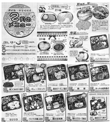
すでに実施されている他市中学校の委託弁当メニューの例

●「Die-gis」参加の起業家の育成を支援し、市内定着が図れる優遇措置制度を創設すべき。