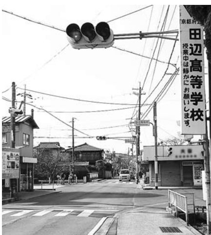
安全対策が望まれる田辺高校前交差点

①田辺高校前交差点はたいへん危険である。安全対策を。 建設部長 歩行者の安全向上を図るため、交差点の改良(歩道新設)に向け、土地所有者と交渉を進めている。 ②近鉄新田辺駅東口に、障がい者が安心して降りることができる駐停車場の設置を。 建設部長 バリアフリー ③介護保険料の減免制度の周知と充実を。 保健福祉部長 パンフやガイドブック、ホームページ、出前講座も活用し、制度の周知に努める。減免規定項目は研究する。 保健福祉部長 ヘルパ