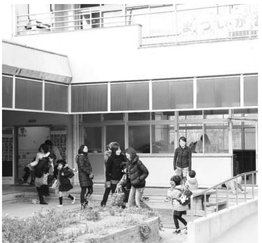
預かり保育でのお母さんのお迎え (松井ヶ丘幼稚園)

長も視野に入れている。② 現在、市が自転車ネットワーク構想を構築中と聞く。エコで健康にも資する自転車を市民が安全・快適に利用できるような環境整備することは、大いに期待する。同志社大学の学生も「全国まちづくり政策フォーラム」で提案されるなど関心は強い。具体的に整備するルートは、市民の利用頻度が高い駅、学校などの公共施設、商業施設につながる路線を優先してもいい。