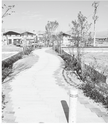
住宅開発により市道認定された同志社山手地区の遊歩道

◆市道に係る道路標識の寸法に関する条例の制定 【賛成多数：可決】 地域主権改革に係る道路法の改正に伴い、道路の安全かつ円滑な交通を確保するため、道路の構造の技術的基準を定めるもの。