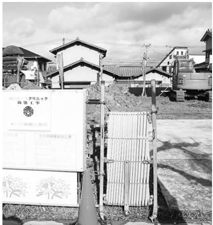
病児保育が行われる医院の建設予定地(松井ヶ丘地内)

①超過勤務縮減の対応策は、また、職務内容、業務内容を見直す。また、総務部長 ノー残業デ