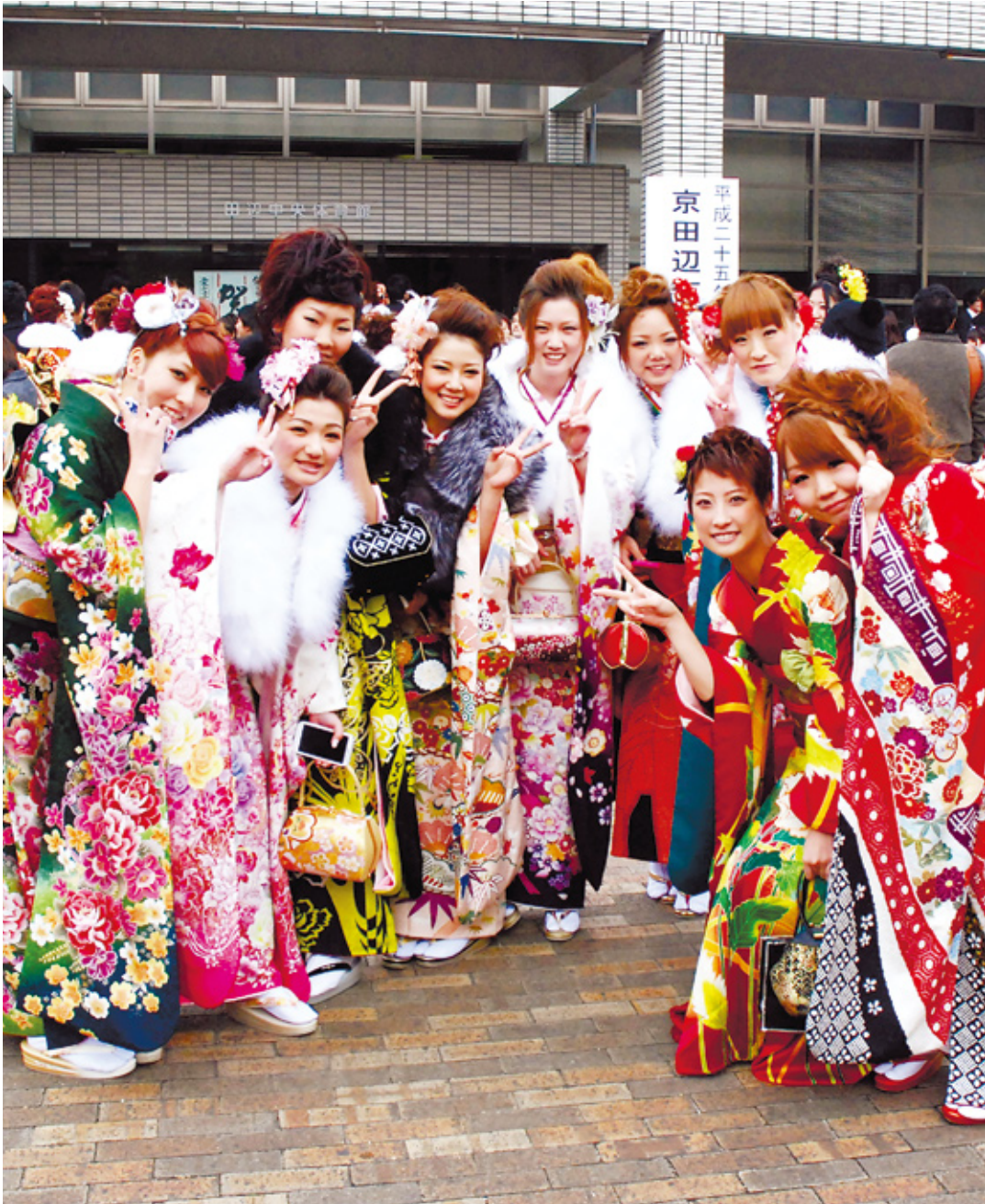
晴れやかに、さわやかに、にこやかに、大人へ（成人式から）