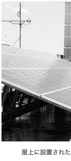
屋上に設置された太陽光パネル