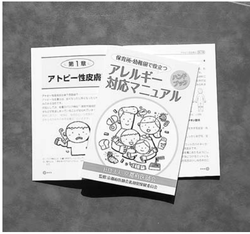
さまざまなアレルギーに 対応するためのマニュアル