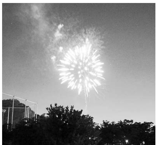
去年の夏京田辺カーニバルでの花火の打ち上げの様子

建設部長 過日の都市再生整備計画事業評価委員会の審議の結果、達成状況は妥当と判断された。しかし、さらなる課題等にも解決する方策を検討していきたい。