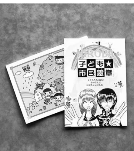
高浜市の子ども憲章の冊子

取り巻く環境は深刻である。1994年に「子どもの権利条約」が批准され、各地で「子ども憲章」が制定されてきている。本市の子どもたちがいきいきと生活し、育っていくことを目的に「子どもの権利条約」に基づいて、 子どもが健やかに生まれ育つための施策を行っている。子ども憲章は、将来的な検討課題である。 ②学校給食と食教育。群馬県高崎市では、幼稚園・小・中学校すべて自校直営の給食が実施され、「食教育」を一番大事にされている。「食を通して、人と人のつながりの豊かさ、命と生きることの原点、そして人間性・人間形成や教育の原点とすべき。栄養士の身分を正規職員として保障し、自校直営で行うべき。また、中学校給食の現場では、残りかすもなく、落ち着いた雰囲気の中であった。自校直営の中学校給食を行うべきと考え るが、市の考えは。教育部長 地元食材の利用に努めたい。中学校給食においては、平成24年度末をメドに検討委員会として結論を出す。 ③聴覚障がい者にとっでは、情報やコミュニケーションの保障は大切である。⑦以前行っていた補聴器用電池購入の補助をすべき。⑧両耳が70デシベル以上でなければ身体障害者手帳が交付されない。高額の費用の負担であり、特に難聴児に対する補助をすべき。 保健福祉部長 ⑦電池購入の助成は、現在、考えていない。⑧補聴器の市独自の助成については、引き続き検討したい。