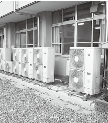
大住中学校に設置された空調機器

山手幹線の大住ヶ丘から八幡方面の渋滞の対策には、計画されていた府道池ノ端丸山線の整備を急ぐよう要望すべきではないか。建設部技監 府として多くの事業があり、すぐ