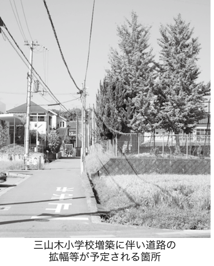
三山木小学校増築に伴い道路の拡幅等が予定される箇所

◆図書館の図書購入 図書館図書の購入について、本の購入を要望した人しか読まないような専門的な本を購入しているのでは。