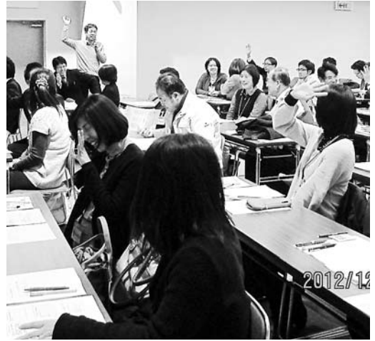
市職員を対象にしたゲートキーパー講習会

①身近な人の自殺を防ぐための「ゲートキーパー」の育成を進めるため、市民や市職員に研修してはどうか。 保健福祉部長 12月に障害福祉関係の事業所や社会福祉協議会、民生児童委員などを対象に予定。2月に市民向けに自殺予防についての研修会も予定。職員研修は、12