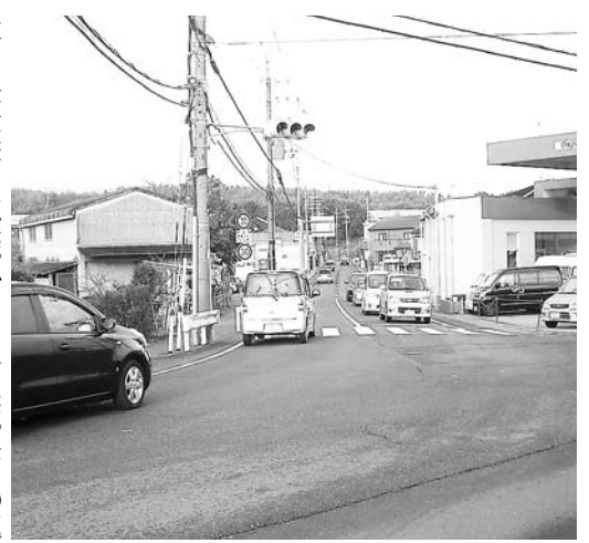
自動車の通行が増えた富野庄八幡線(三野交差点)

㊿市内学校の認知件数は4件。ひやかし、からかい、仲間外れなどで、すでに解決済み。