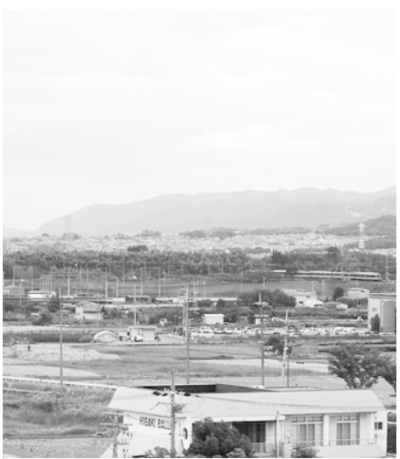
総合複合施設が提案された近鉄新田辺駅周辺地域

①画期的発想でスポーツ施設や文化施設等を駅周辺に集積し、総合型複合施設を提案する。国や