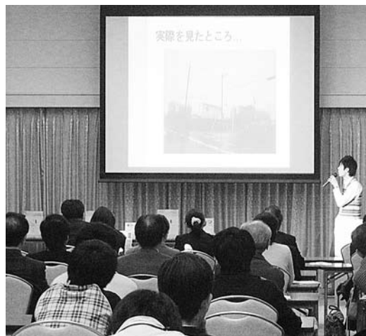
全国大学まちづくり政策フォーラムでの発表の様子

●「Die-gis」参加の起業家の育成を支援し、市内定着が図れる優遇措置制度を創設すべき。