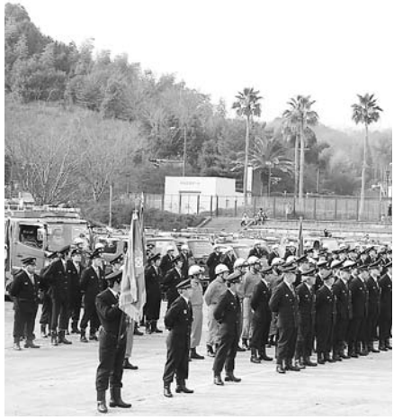
災害時に大きな役割を果たす消防団

⑦ 施設園芸等の整備⑧ 農産物販売施設等の整備⑨ 遊休農地、荒廃農地解消の取り組みについて。