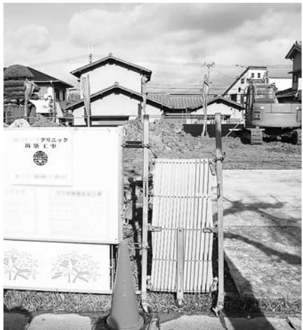
病児保育が行われる病院の 建設予定地(松井ヶ丘地内)

⑤JR京田辺駅と近鉄新田辺駅間を通行する乗降客等をターゲットにした具体的地域活性化策は。経済環境部長 この間は1日延べ4万人が利用している。市商工会が中心に平成25年1月に大型イベント「京たなべ」イベントを開催する。⑥病児・病後児保育の実施は。保健福祉部長 25年度の早い時期に市内医療機関で開始したい。定員は6名程度で病後児保育も合わせて考えており、今後は病児保育が1カ所、病後児保育が2カ所というふうになる。