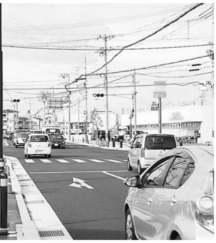
右折矢印信号機の設置が 予定されている二又交差点

①本市の子育て支援医療費助成制度では、小学校卒業まで医療費(通院)が無料となっている