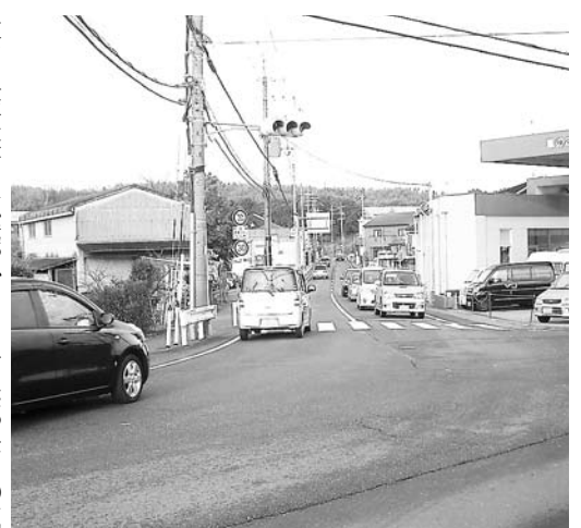
自動車の通行が増えた 富野庄八幡線(三野交差点)

⑮市民部長 ⑯現在、大学・女子大学・大学院合わせて約1万9600人。文系学部移転後の4月以降は約1万3100人。⑰スポーツ、文化関係、まちづくり等各分野で連携協働。今後も、大学特有の知的資源を生かした連携を図っていく。