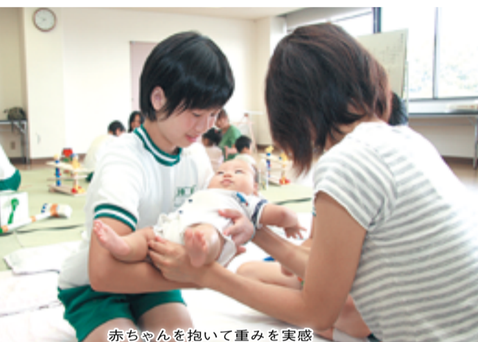
赤ちゃんを抱いて重みを実感

市は、思春期育児体験事業の参加者を募集します。 少子化・核家族化で乳幼児と接する機会が少なくなった思春期の子どもたちが、乳幼児と触れ合う体験から愛おしいと感じる心や命の尊さを学びます。 【日時】12月25日(火)午前9時30分~11時30分 【場所】子育てひろば「てふてふ」 【対象】市内に在住する中学生 【定員】先着10人 【しめきり】12月20日(木) 【申込方法】はがきに「思春期育児体験事業参加希望」・氏名・生年月日・郵便番号・住所・電話番号・中学校名・保護者了解の上「思春期育児体験事業に参加することを了解します」・保護者氏名を書いて、郵送してください 【申込・問合せ先】こども福祉課 (☎ 64-1377)