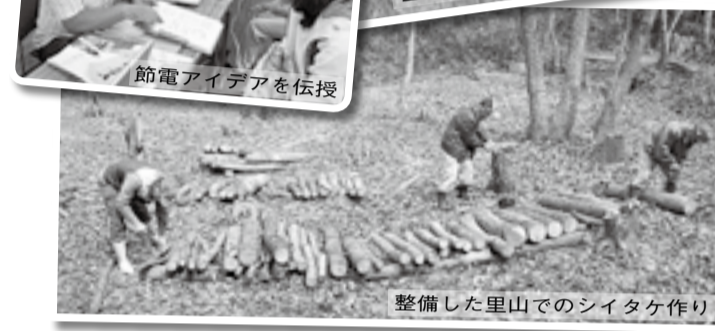
ごみを拾いながらのエコ・ウォーキング。整備した里山でのシイタケ作り。