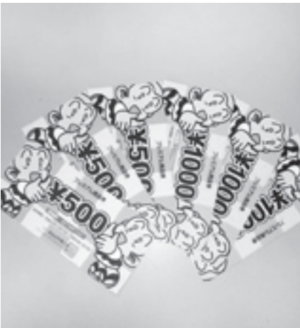
今年も発売されたプレミアム商品券

◆節電所という考え 副市長 各家庭が省エネに努めることで、残ったエネルギーを積み重ねると発電所を建設したと同等と考え方で、これを節電所という。この考えを温床化対策実行計画に盛り込んでいきたい。