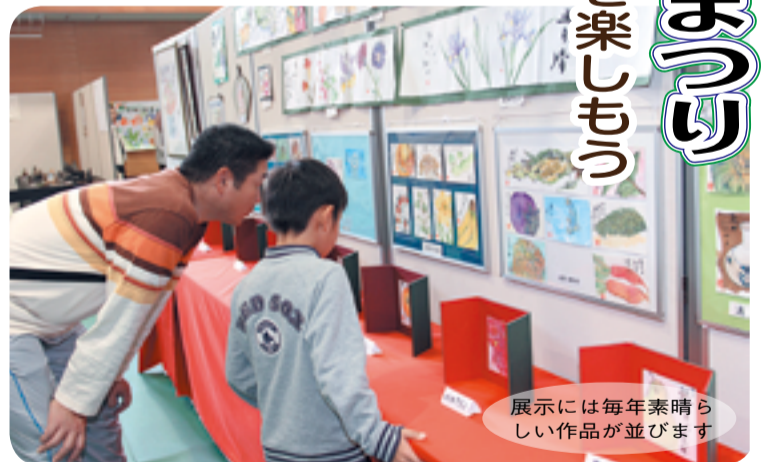
展示には毎年素晴らしい作品が並びます

保育を希望する人は11月22日(木)までに申し込んでください。 【作品展示】 人権をテーマに、市内の子どもたちが描いた絵や作文などを展示します 期間 ＝12月1日(土)～9日(日) 1日は午後1時から、9日は午後4時までです。 場所 ＝▼中央公民館 ▼北部住民センター ▼中部住民センター 【申込・問合せ先】 ▼人権啓発推進課(☎64-1336) ▼社会教育・スポーツ推進課(☎64-1394)