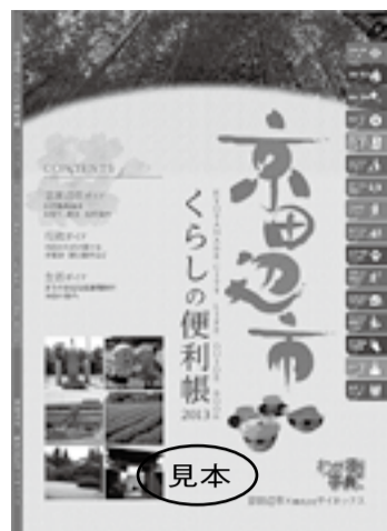
観光やイベントなどの情報も掲載

【冊子の規格・発行部数】 規格＝A4判(4色カラー印刷)、約130ページ 発行部数＝3万部 【問合せ先】 ▼市長公室(☎64-1320)▼ (株)サイネックス(☎075-315-0085)