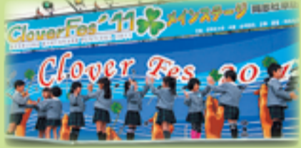
幼稚園児が遊戯を披露(昨年の様子)

同志社クローバー祭実行スタッフは、「あなたの四つ葉を見つけよう」をキャッチフレーズに、同志社クローバー祭(同志社京田辺祭)を開きます。 体験コーナーや模擬店など、楽しい企画が盛りだくさん。思う存分楽しみましょう。 日にち=11月3日(祝)・4日(日) 場所=同志社大学京田辺校地 内容=▼同祭ヒーロー「タナレンジャー」のヒーローショー▼巨大迷路▼移動動物園▼ふわふわドーム▼体験コーナー(陶芸・世界の民族衣装・アンチエイジング測定)▼模擬店(飲食物・フリーマーケット)▼野外ライブなど また、東日本大震災の復興支援のため、被災地の物産展や、被災地へメッセージを届ける企画もあります。詳しくは、同志社クローバー祭ホームページ( http://doshishacllover.web.fc2.com/ )をご覧ください。 問合せ先=同志社クローバー祭実行スタッフ事務室(☎65-7832)