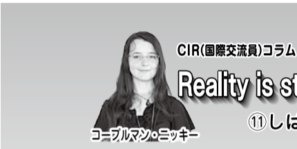
コマルアツシニキキ

8月26日(日)9時30分から、田辺公園テニスコート☑市内に在住・通勤・通学する高校生以上の人◎混合ペア2組の団体戦。女子ペアで