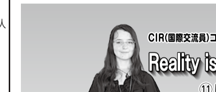
コマルアツシニキキ

8月26日(日)9時30分から、田辺公園テニスコート☑市内に在住・通勤・通学する高校生以上の人◎混合ペア2組の団体戦。女子ペアで