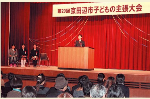
ステージで自分の思いを述べる発表者(昨年の様子)

チラシなどに掲載する場合があります。規格 原稿用紙(400字詰)4枚以内。1人1点で未発表の作品に限る。応募方法 作品の裏面に住所・氏名・学校名・学年・電話番号を書いて応募してください。 応募先・しめきり 市内小学校の6年生・市内中学校および生駒北中学校の生徒。在籍する小・中学校に学校が指定する日までに提出してください。そのほかの人: 9月28日(金)までに子ども福祉課へ郵送・電子メール・持参してください。