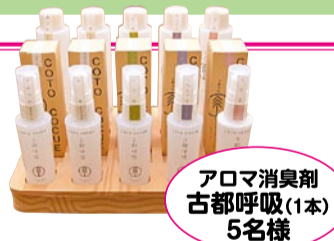
アロマ消臭剤 古都呼吸(1本) 5名様