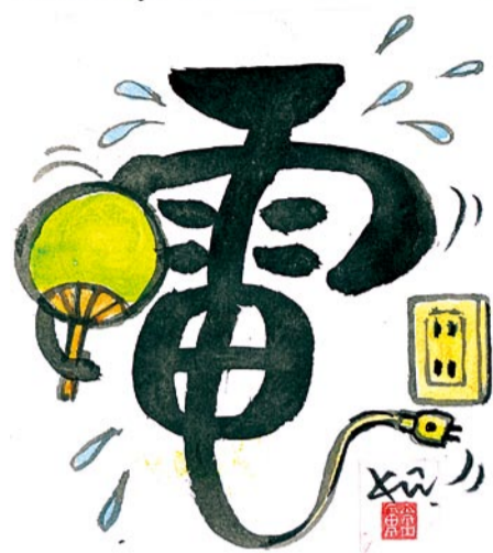
【節電のところがまえ】

本市でも入所希望者が年々多くなっています。家庭を応援するため、昨年度は北部地域において松井ヶ丘保育園の新設・移転を支援しました。 今年度は、同志社山手地区の開発などにより人口増加が進む南部地域において、三山木保育所への入所希望者をすべて受け入れました。 その結果、同保育所では入所児童数が昨年度を大きく上回ったこと