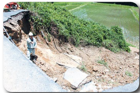
崩落現場(天王裂石(さちいし))

大雨で市道が一部崩落 通行規制にご理解を 6月21日・22日の大雨により、市道津田天王線の道路が一部崩落しました。市は当面の間、道路復旧のための終日通行止めを行いますので、迂回をお願いします(歩行者を含む)。また、京阪バス(株)の路線バスは「宗谷」バス停留所(大府枚方市)で折り返し運行となりますので、ご理解をお願いします。 問合せ先▶安心まちづくり室(☎64・1307)▶施設整備課(☎64・1346)