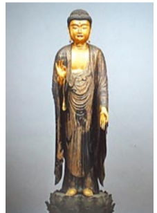
木造阿弥陀如来立像