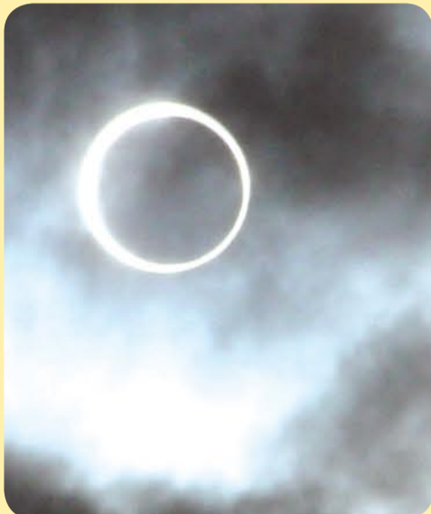
④薄雲がかかり、肉眼でも光のリングがくっきり。