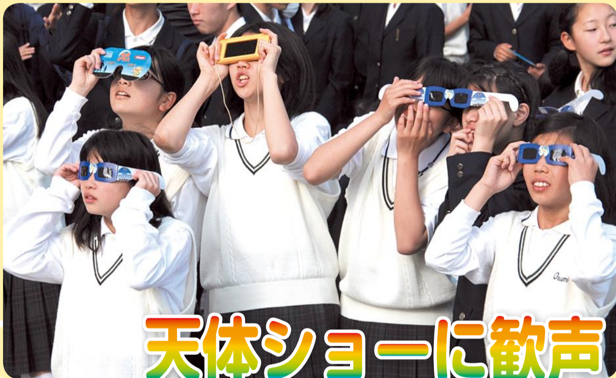
⑤市内の小・中学校では、金環日食に先立ち、天文台から専門家を招き授業を行ったところも(5月18日・培良中学校の様子)