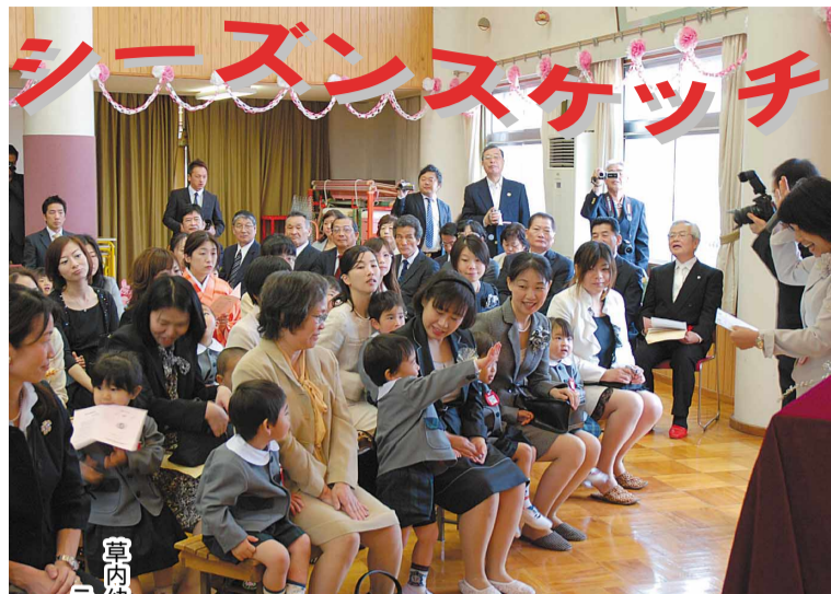
室内幼稚園での入園式(写真上) ライトアップされる桜の花(虚空蔵谷川畔)(写真中) 非核平和都市宣言之碑除幕式(写真下)