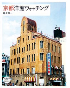
『京都洋館ウオッチング』 井上章一 / 著 新潮社 / 発行