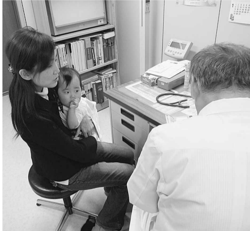
予防接種を受ける乳幼児

員に入っていたりなど今後検討すべき。 ②消防団の女性団員の募集をもっとPRすべき。消防長 活動できる環境整備をする中で、PRを進めていきたい。 ③被災地の声を伝え、防災教育の充実をはかるべき。 教育次長 被災地へボランティアに行った先生の体験談が話された。意義深い話であったので要望のある学校から実施できればいい。 ④市庁舎の整備についてペヒーカーを設置してはどうか。 保健福祉部長 前向き