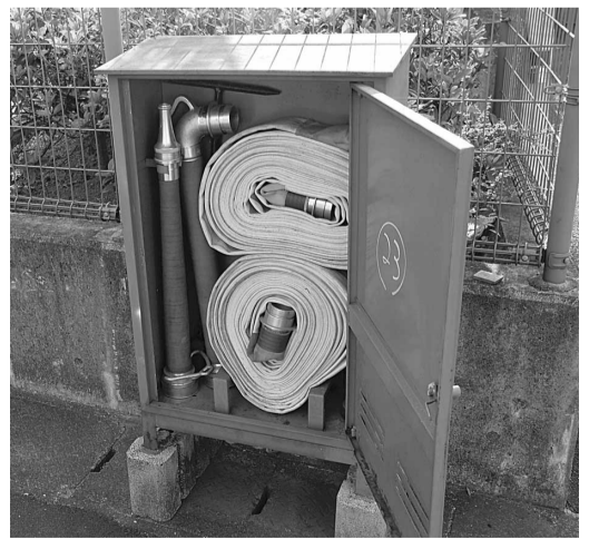
地域に配備されている消火器具ボックス

犯罪行為の抑止効果を高めるため、平成23年度中に新田辺駅西口周辺6ヶ所に設置予定。今後は警察や関係団体と連携し、強固な体制を構築したい。 ④三山木地区特定土地区画整理事業の進捗状況と今後の計画について。 ⑤高齢者や障害のある人への対策として、点字誘導ブロックは不可欠だが未整備の箇所がある。また、整備中の歩道の車止めについての見解は、建設部長 都市計画道路の歩道には計画的に点