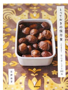
『とっておきの保存食』 荻野恭子／著 NHK出版／発行

忙しい日の晩ごはんには、作り置きしたおかずが一品あると、とても便利です。この本では、「梅干