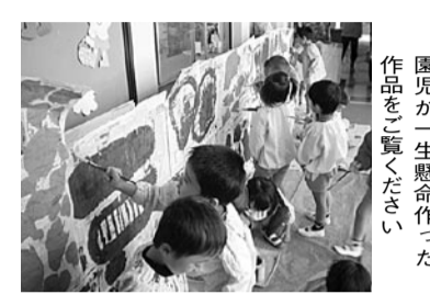
園児が一生懸命作った作品を鑑みてください

1月13日(金)～15日(日)9時30分～16時30分、コミュニティホール◎市立幼稚園全園児の作品を展示。幼児の豊かな心や表現力・創造性に触れてみてください◎京田辺市立幼稚園教育研究会(大住幼稚園内、☎62-7405)