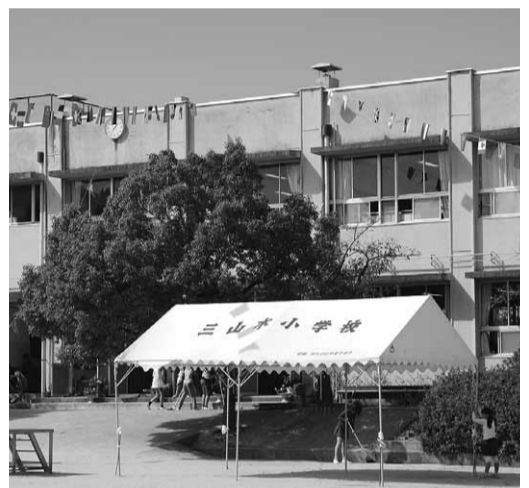
児童の増加が見込まれる三山木小学校