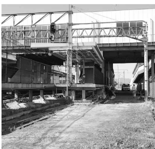
4番線工事が進むJR京田辺駅