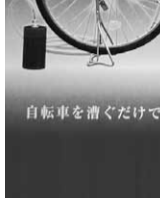
自転車搭載型浄水器

安心まちづくり室長 飲料水確保の新たな方法であるので研究していきたい。今後、自主防災会等、いろいろな所で紹介していきたい。