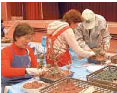
初めての人も丁寧に指導します

申込・問合せ先 京田辺市都市緑化協会 〒610-0331 京田辺市田辺28-1 ☎ FAX 63-0433