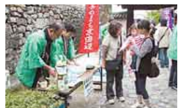
市特産の玉露が味わえます(昨年の様子)

場所= 酬恩庵一休寺参道 内容= 玉露の無料接待・京田辺茶手もみ技術保存会の会員による手もみ製茶の実演・