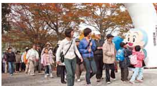
秋の京田辺を歩いてみよう(昨年の様子)

9月末までに申し込んだ人には10月上旬、10月以降に申し込んだ人には11月上旬に、参加証を発送します。