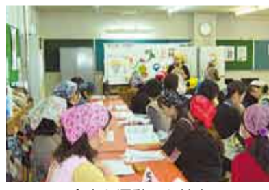
食事と運動から健康について学びます

市は、きれいと言え、健康の秘訣を学ぶ健康セミナー「Your Life」の参加者を募集します。対象=市内に在住する20~40歳代で、3回以上参加できる人。定員=先着35人。参加費=無料。申込方法=電話で申し込み。電話で申し込み。電話で申し込み。