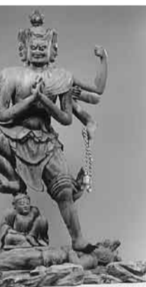
隆三世明王、金剛夜叉明王立像(寿宝寺所蔵)

明治初めに月読神社内にあった福養寺薬師堂から移され、秘仏として伝えられている像で、高さ130.2cm、平安時代前期9世紀に製作された初期の木造の像です。