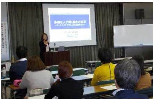
▼過去のセミナーの様子