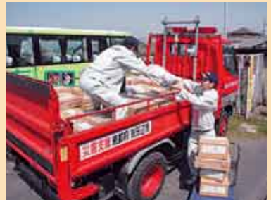
支援物資を積み込む職員