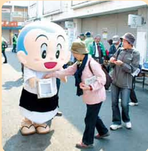
さまざまなイベントで募金活動が行われています

また、市ホームページや報道機関を通じてお願いしました缶詰・カップラーメン・レトルト食品などの支援物資は、160人から7,887点のご協力をいただき、京都府を通じて福島県内の避難所にお届けしました。市は、市民のみなさんの温かい善意を被災地へ届けるほか、人的支援のための職員派遣など被災地復興に向け可能な限り支援してまいります。義援金は、引き続き受け付けていますので、今後もお協力をお願いします。