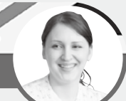
ランドワイガッス

みなさん一番好きな季節は何ですか？8月生まれの私は、夏が好きです。そして、子どものころから苦手なのは冬でした。しかし、最近考えが変わりそうです。