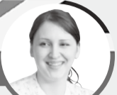
ランドワイガッス

みなさん一番好きな季節は何ですか？8月生まれの私は、夏が好きです。そして、子どものころから苦手なのは冬でした。しかし、最近考えが変わりそうです。イギリスの冬はとて寒く、日が短くて、空が灰色で、気持ちが落ち込んだりします。家の中にはセントラルヒーティングがあるので家を出なくなり、まるで冬眠をしているようです。私の楽しみは、自宅には暖炉があって、猫と一緒に前に座って本を読むことです。日本の冬には、イギリスで手