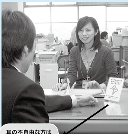
耳の不自由な方は筆談しますのでお申し出下さい