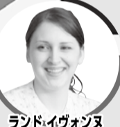
ランドイワオンナ

日本の料理といえば、世界一健康的だといわれています。野菜も魚も大豆もいっぱいあって、体にとてもいいですね。しかし、最近はファストフードなどの店の数が増えています。最初に日本に来たとき、私が気に入ったのは和風ファストフード(パンの代わりにご飯を使ったハンバーガー、抹茶が入ったミルクシェークなど)です。ファストフードも日本の味を入れると、少し健康的になる気がします。