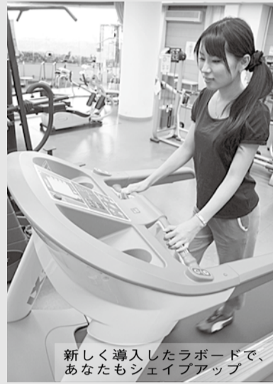
新しく導入したラポードで、あなたもシェイプアップ

なお、初めて利用する人は、トレーニングルーム利用講習会の受講が必要です。問合せ先=田辺中央体育館 (☎62-1501)