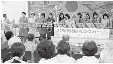
7月に行われたロビーコンサート