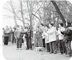
④緑に囲まれた山道が続きます⑤山頂で「京田辺市の歌」を大合唱