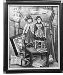
「人形と雑然とした静物」30号