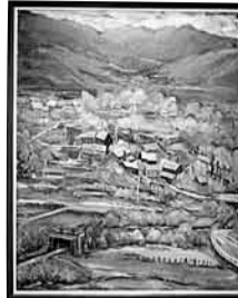
「水門のある焼物の村」100号