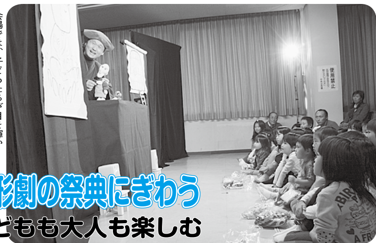
会場では、子どもたちが目を輝かせて人形劇を鑑賞していました