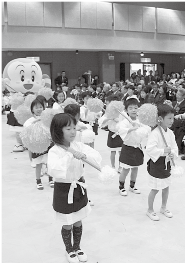
薪幼稚園・草内保育所園児が一休さんやキララちゃんと一休音頭を披露