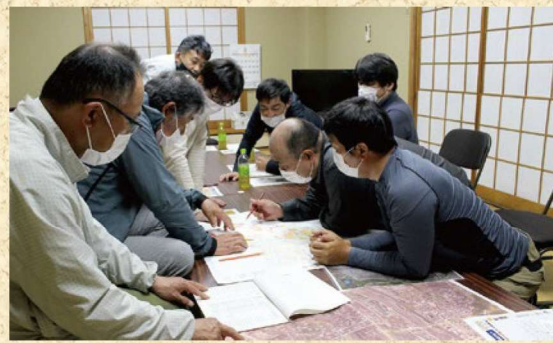
それぞれが持つ情報を、地図に共有します。

農家の皆様は、一人・農地プラン」という言葉を一度は耳にされていると思います。これは、地域の担い手に農地を預けていくための将来に向けたプランです。 令和5年4月に同プランが「地域計画」として法定化され、誰がどの農地を守っていくのかを地域で話し合っ具体的示すこととなりました。 各区で決めなければならぬポイントは2点あります。ひとつは、守るべき農地の状況を把握するための地図作製（写真）です。江津区では、担い手などが集まって農地一筆毎に耕作者の年齢を色分けし、今後担い手との交代が近い高齢者が管理