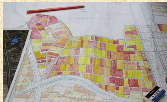
江津区では、耕作者の年齢別色塗りはほぼ終わりました。

している農地を、全員で把握しました。 ふたつ目は担い手リストの作成です。これまで、市が公告していた農地の貸し借り（利用権設定）がなくなり、中間管理機構が手続きをします。今後はリストに搭載された信頼のある人にしか、農地の貸し借りが原則できなくなります。