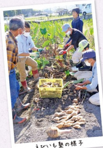
えびいも塾の様子