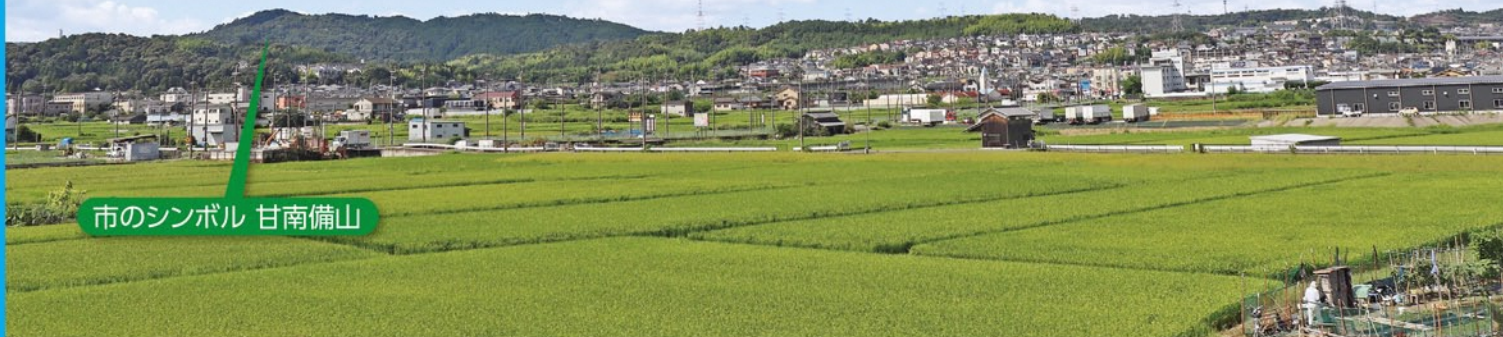
市のシンボル 甘南備山

薪地区の農地は、西側の甘南備山のみならず、東側の木津川へと広がる扇状地です。山側の田んぼは段差があり、ほ場整備(農地の形を整えて道路や水路を整備すること)ができていないのが課題です。川側は、条里制(昔の農地の区画整理)の跡が見られ、農地を囲むように里道が直角に交差しているため、整形を意識して作られたことが伺えます。