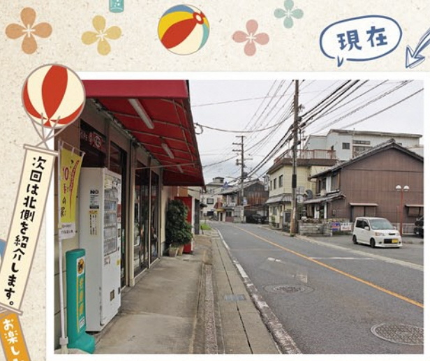
現在の街並み。今も数店舗は営業を続けています。