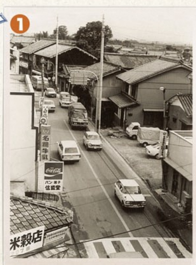
写真下側の交差点から、奥へ商店街が広がっています。