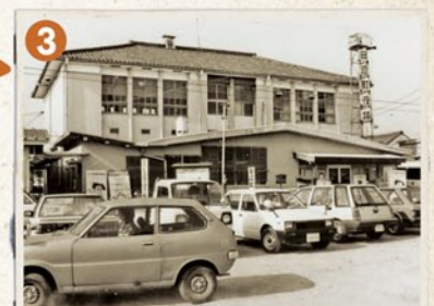
駅前にあった田辺町役場。現在の中央図書館の場所です。