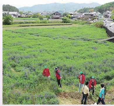
ヘアリーベッチが一面に咲きました。

普賢寺地域では、農業委員会の委員が集まって、今後の地域農業をどうしていくかを話し合う「地区連絡会議（地区連）」を毎月開いています。 その中で、開花時期にきれいな花をつける景観作物を利用し、農業と村おこしを両立させる案に挑戦。地域内では、すでに大御堂観音寺前の農地で、菜の花を植えて人を集めることに成功しています。 今回はマメ科の「ヘアリーベッチ」を採用。合計約7千平米の農地を使い、村おこしの実験を