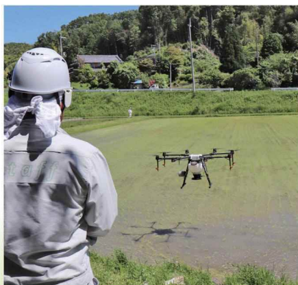
1,000㎡の除草剤散布が10分弱で終わります。

普賢寺地域では、ドローンを使った肥料やり・除草剤の散布を始められています。これまで手作業で