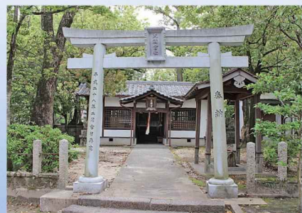
河原公民館隣の天満宮社

河原公民館のとなりにある「河原天満宮社」(写真)は学問の神様です。ここでは、年頭に行われる歳旦祭、子供神輿でにぎわう秋祭り、町内会、子供会、老人会など、和気あいあいと交流があります。そのすぐ裏側に観光スポットのひとつ、伽羅古戦場跡の石碑がひっそりと建っています。