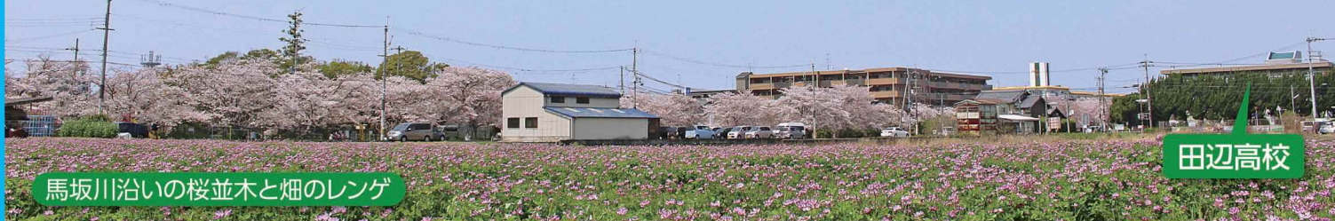
馬坂川沿いの桜並木と畑のレンゲ

近年、耕作者の高齢化・担い手不足が進んでいますので、農業委員・農地利用最適化推進委員が両輪となり、農家の皆様や農家組合と共に農業を守っていかねばならないと思います。