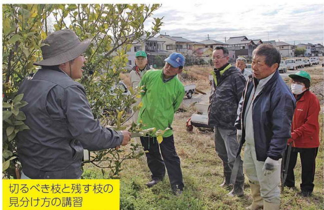
切るべき枝と残す枝の見分け方の講習