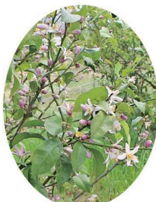
5月、ほぼすべての樹木につぼみと花がつけました。

今年の2月末、3月上旬にかけて山城北農業改良普及センター職員(指導のもと、レモンの樹木剪定と土壌改良を実践しました。) レモンの木は不要枝が多く育ち、古い根は養分を吸収しにくくなるため、生長期の春を前に作業が必要になります。