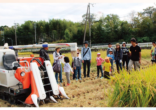
農家が横についてコンバインを体験。作業中は自動のため、操作は必要ない。