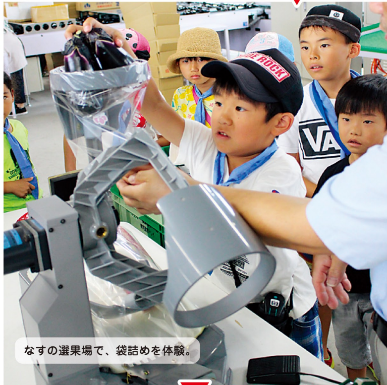
なすの選果場で、袋詰めを体験。