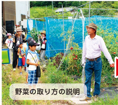
野菜の取り方の説明