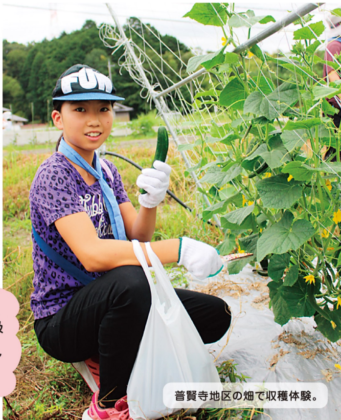
普賢寺地区の畑で収穫体験。

中央公民館の調理室で食生活改善推進員（食改さん）といっしょにとれた野菜を調理。ママさんたちも参加しました。