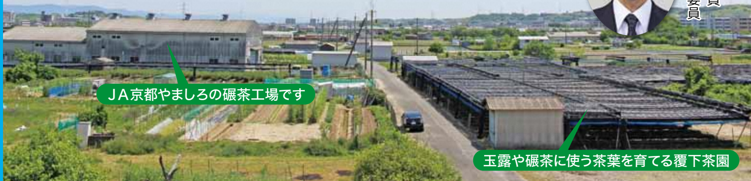
JA京都やましろの碾茶工場です

現在、区内の農地をより使いやすくするための排水事業を進めています。これにより、若い担い手が新しい作物に挑戦し、大規模農家となることを期待しています。