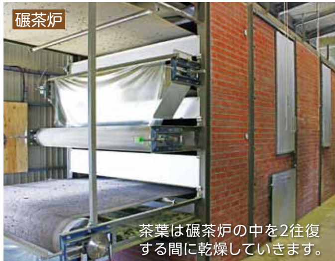
茶葉は碾茶炉の中を2往復する間に乾燥していきます。