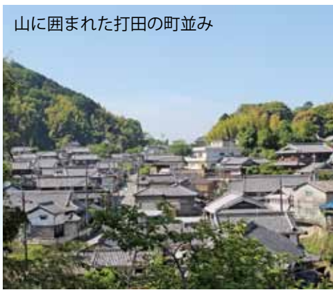
山に囲まれた打田の町並み

その反面、地域の課題も多く、地区住民の半数近くが60歳以上の高齢者であり、担い手不足の中、傾斜地・棚田が多く草刈りなどの作業が大変です。また、約10年前から有害鳥獣であるイノシシが出没しだして、田畑を荒らすので対策が必要です。山間部での農作業は苦勞が多いですが、地元の農地が荒れないように守っていききたいと思っています。