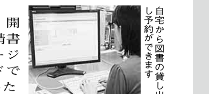
自宅から図書の貸し出し予約ができます

▼平成21年度の進捗状況は、184件が完了し、進行中は214件、その他は81件でした。平成21年度の主な取り組みは次のとおりです。くわしい進捗状況は、市ホームページをご覧ください