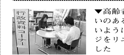
行政資料コーナーでは広報紙・統計情報などが閲覧できます

できるようにしました▼新区・緑化協会と花の一休寺道の緑地に係る協定を締結し、市民と連携した公園緑地管理を進めました