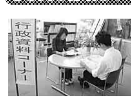
行政資料コーナーでは広報紙・統計情報などが閲覧できます

▼高齢者や視覚に障がいのある人が使いやすいように、ホームページをリニューアルしました▼市役所2階に行政資料コーナーを設置し、行政情報を自由に閲覧できるようにしました▼新区・緑化協会と花の一休寺道の緑地に係る協定を締結し、市民と連携した公園緑地管理を進めました