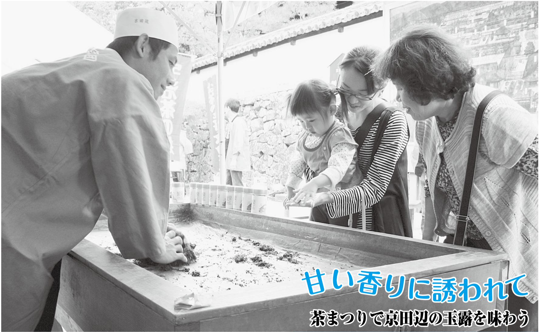
甘い香りに誘われて 茶まつりで京田辺の玉露を味わう

酬恩庵一休寺の総門から香る甘いお茶の香りに誘われた参拝者が、京田辺の玉露で一休み。10月3日に茶まつりが行われ、約400人が来場しました。