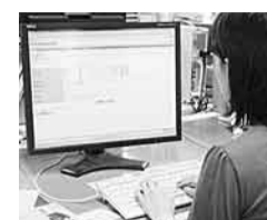
自宅から図書の貸し出し予約ができます

▼市の施策や事業を市民へ広く知ってもらうため、職員を講師として派遣する出前講座をスタートしました▼中央図書館に、図書貸し出しシステムを導入し、インターネット予約ができるようになりました▼開発指導要領・開発行為等協議申請書などをホームページからダウンロードできるようにしました