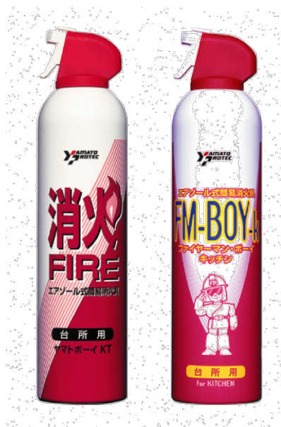
自主回収対象製品

しかしながら、同社によれば、本年 10 月 12 日時点で、回収又は廃棄が確認された当該製品は 61,744 本で（このうち、破裂などの事故が 3,832 件）、残りの約 120,000 本が未確認となっており、これらのうちのかなりの部分がまだ廃棄されていない状態にあると考えられるとのことです。