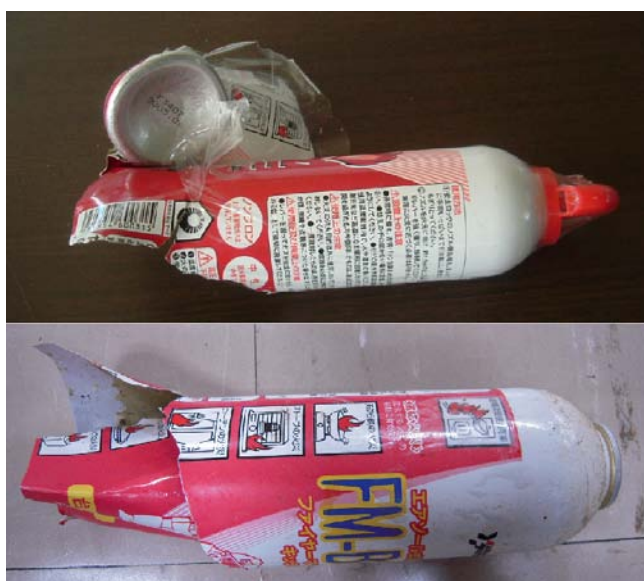
自主回収対象製品の破裂時の写真