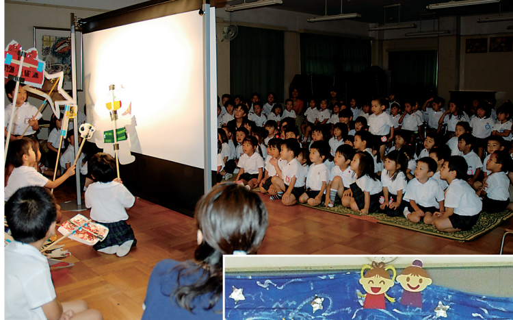
みんなで協力して 歌や出し物を披露 -薪幼稚園七夕会- (写真上・右)