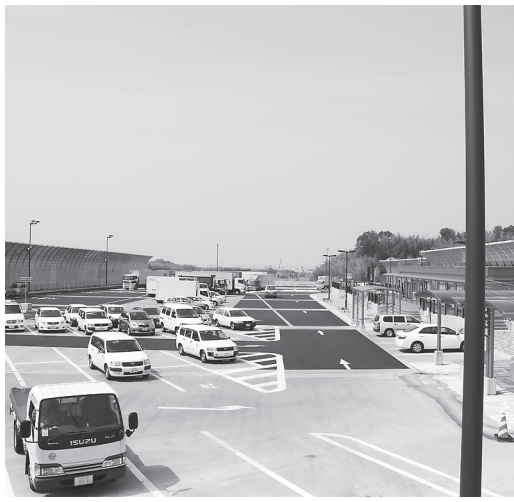
第二京阪京田辺パークキングの外観

【賛成全員・可決】 南田辺北特定土地区画整理事業の施行により、本市三山木綾ヶ谷、多々羅駒ヶ谷、普賢寺中島の区域の一部または全部を同志社山手一丁目から同志社山手四丁目町の区域を変更するもの。