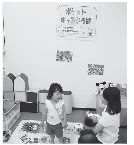
子どもの遊ぶスペースが設けられた女性交流支援ルーム