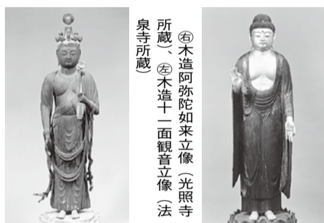
①木造阿弥如来立像(光照寺本尊) ②木造十一面観音立像(法泉寺本尊)

ヒノキで作られ、割削造です。髻に仏面一つ、その下に菩薩面十を持つ十一面観音像です。整った像容ですが、頸部が不自然なほど長く、そのわりに体部は小ぶりに作られています。