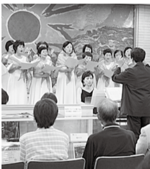
昨年のロビーコンサート